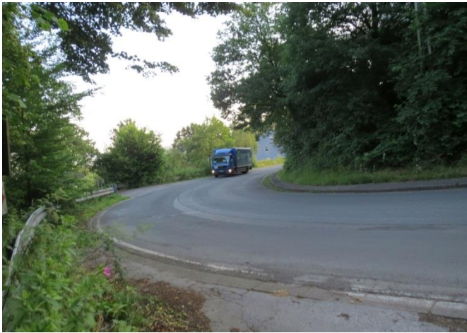
Die Kurve an der Vormholzer Straße.

gez. Christian Held Sachkundiger Bürger der CDU